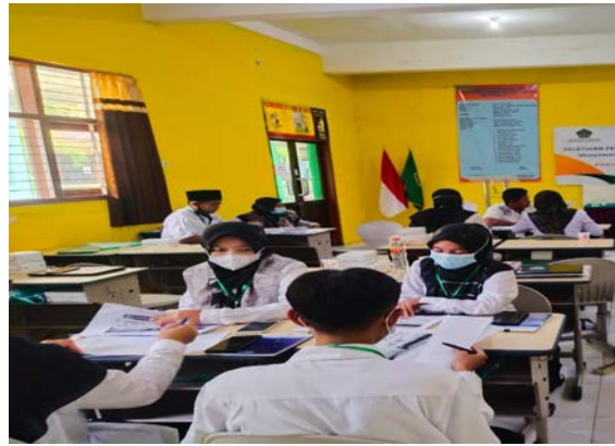
Gambar 2. Peserta Peningkatan/Penguatan Kemampuan dan Kompetensi (04 Oktober 2021 dan 06 Oktober 2021).