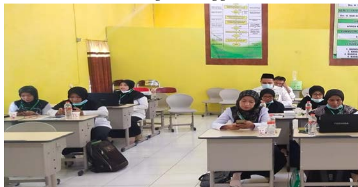
Gambar 3. Kegiatan Workshop Pengaplikasian CHATBOT dan SMART RECTORMU pada Mobile devices (5 Oktober 2021 dan 7 Oktober 2021)

Pada kegiatan workshop ini, team PKM melatih dan sekaligus melakukan praktek langsung pengaplikasian kedua aplikasi e-learning tersebut dengan menggunakan mobile devices baik itu berupa smart phone ataupun Laptop. Pada kegiatan ini mampu meningkatkan: 1) keterampilan para guru dalam mengaplikasikan aplikasi e-learning CHATBOT yang kemudian akan dipraktikkan kepada siswa mereka nantinya, 2) para guru mampu dan terampil dalam merancang perangkat pembelajaran pada aplikasi e-learning SMART RECTORMU baik itu berupa video pembelajaran dan pembuatan tugas pembelajaran siswa, 3) mampu mengdesain evaluasi pembelajaran melalui aplikasi e-learning SMART RECTORMU dengan menggunakan mobile devices .