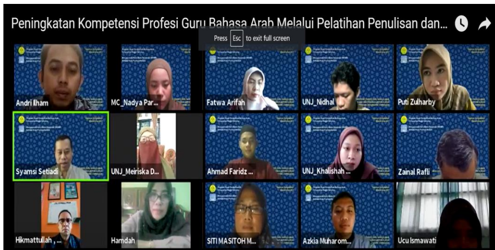
Gambar 1. Dokumentasi pelaksanaan Pengabdian kepada Masyarakat

Kegiatan selanjutnya yaitu pendampingan yang dilakukan dengan langkah berikut: 1) Teknis cara mendownload aplikasi Mendeley ke perangkat laptop dan menginstal aplikasi tersebut sampai dapat dioperasikan di perangkat laptop; 2) guru-guru dilatih untuk menemukan artikel-artikel ilmiah dan praktik cara mengunduh artikel tersebut menggunakan Mendeley Web Importer yang telah diaktivasi; 3) selain itu, guru-guru juga dilatih untuk menyimpan artikel yang sudah ada di dalam perangkat laptop menggunakan teknik drag and drop , atau dengan cara insert manual ; 4) bagi guru yang telah memiliki artikel ilmiah diminta untuk membuka file dalam format word kemudian dilatih cara mengutip menggunakan Mendeley dari artikel yang sudah disimpan di Mendeley. Sedangkan bagi guru yang belum mempunyai draf artikel, diminta untuk membuka word dan dilatih untuk membuat kutipan; dan 5) guru-guru dilatih untuk membuat daftar Pustaka otomatis dari hasil pengutipan. Menurut Yusdita & Utomo (2019) aplikasi Mendeley dapat membantu mempercepat menyusun referensi dengan gaya selingkung (Yusdita & Utomo, 2019). Tim pengabdian telah menyiapkan sebuah video tutorial pada Gambar 2 agar manfaat dari kegiatan ini dapat dirasakan oleh masyarakat pada umumnya. Video diunggah pada lama Youtube https://www.youtube.com/watch?v=wZPYSgZ_PGM .