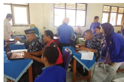
Gambar 3. Pemberian materi pelatihan pembuatan media pembelajaran dengan electronic presentation