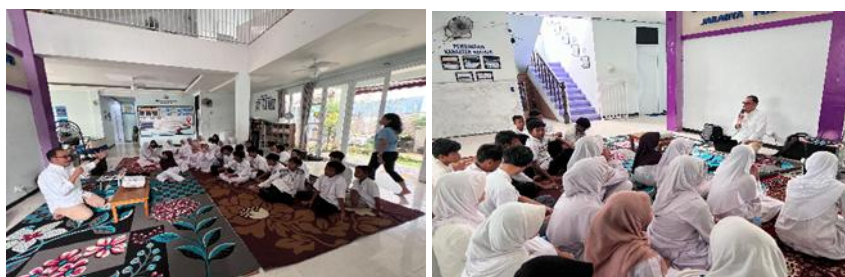
Gambar 2. Aktivitas penyampaian materi tentang Learning Agibility & Motivation

Komunikasi efektif dapat dipahami sebagai kemampuan penyampaian pesan dengan jelas sehingga dapat dipahami oleh penerima (Rahayu, 2023). Larson dan Knapp (Zahra et al., 2022) berpendapat bahwa komunikasi efektif dicapai dengan mengupayakan akurasi tertinggi antara pemberi informasi dengan penerima informasi. Kedua pihak harus berbagi kesamaan dalam pemahaman, perilaku, dan ucapan. Observasi yang kami lakukan terhadap para peserta menunjukkan masih adanya masalah terkait komunikasi efektif ini. Hal itu terlihat saat mereka diberi kesempatan bertanya atau menjelaskan pandangan mereka.