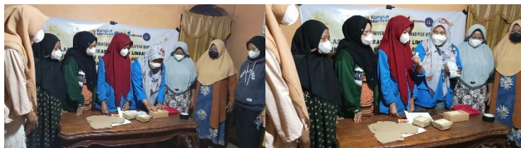
Gambar 5. Pengemasan dan Pelabelan Produk

Setelah produk selesai diproduksi, tahap selanjutnya adalah pengemasan. Produk dikemas dalam kemasan yang sesuai, seperti kotak karton, untuk memastikan kualitas dan mempermudah distribusi (Wahyuni et al., 2022). Dokumentasi pengemasan dapat dilihat pada Gambar 5.