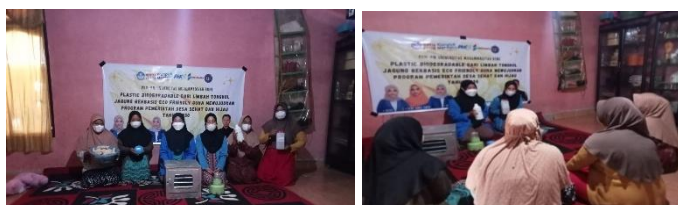
Gambar 3. Persiapan Alat dan Bahan

Tahap ini merupakan langkah penting dalam memastikan kelancaran pelatihan pembuatan produk (Wahyuni et al., 2021; Wulandari et al., 2022). Pada tahap ini, tim perlu menyiapkan semua alat dan bahan yang diperlukan untuk menghasilkan plastic biodegradable . Kegiatan dapat dilihat pada gambar.