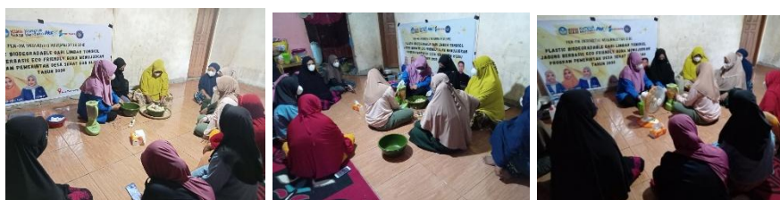
Gambar 4. Proses Pembuatan Plastic Biodegradable

Tahap ini merupakan inti dari pelatihan, di mana tim akan mengubah limbah tongkol jagung menjadi plastic biodegradable . Pelatihan dilaksanakan melalui demonstrasi, dimana mitra ikut serta melakukan pembuatan plastic biodegradable bersama dengan tim pelaksana (Asfar et al., 2021; Rasmianti et al., 2023). Proses produksi limbah tongkol jagung seperti pada Gambar 4.