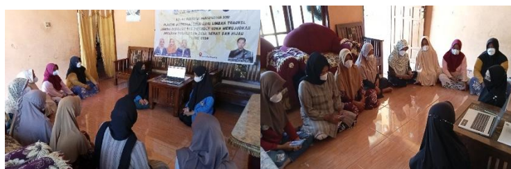
Gambar 6. Edukasi Manajemen (Pemasaran)

Tim menjelaskan kepada mitra mengenai cara pemasaran sederhana menggunakan aplikasi marketplace seperti Shopee . Adapun kegiatan dapat dilihat pada Gambar 6.