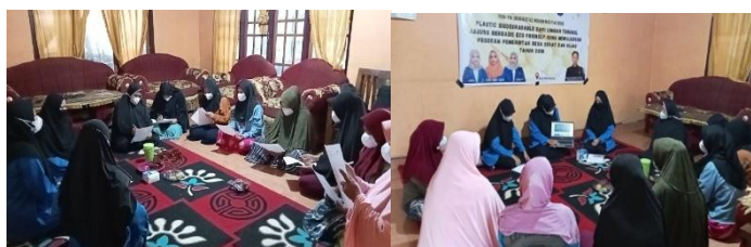
Gambar 2. Sosialisasi bersama Mitra

Pelaksanaan penyuluhan/sosialisasi dilakukan dalam bentuk seminar singkat untuk menyampaikan maksud dan tujuan kegiatan (Asfar et al., 2022; Erviana et al., 2022) dalam hal ini memanfaatkan potensi lingkungan yang dianggap sebagai limbah (tongkol jagung) menjadi plastic biodegradable . Kegiatan penyuluhan dapat dilihat pada Gambar 2.