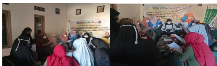
Gambar 7. Pendampingan kepada Mitra

Pada tahap ini, tim mengidentifikasi kendala yang dihadapi mitra. Secara umum, tidak ada kendala yang berarti dalam produksi, namun pendampingan tetap dilakukan untuk memastikan peningkatan pengetahuan mitra dalam setiap tahap kegiatan (Asfar et al., 2022; Asfar et al., 2021). Dokumentasi proses pendampingan dapat dilihat pada Gambar 7.