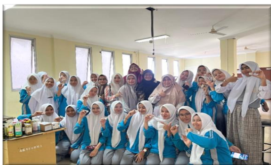
Gambar 1. Penutupan Kegiatan PKM dan Peserta Membawa Pulang Hasil Pembuatan Serum

Kegiatan ini menggunakan model pelatihan berbasis kompetensi, yang berfokus pada pengembangan keterampilan praktis siswa dalam pembuatan produk kosmetik berbasis bahan alami. Model ini sesuai dengan perkembangan pendidikan vokasi yang menekankan pada keterampilan praktis, sesuai dengan penelitian yang menunjukkan bahwa pembelajaran berbasis praktik lebih efektif dalam meningkatkan keterampilan siswa. Agar lulusan SMK dapat berkontribusi secara maksimal dalam proyek seperti PKM, penting untuk mengembangkan kurikulum yang tidak hanya berorientasi pada teori tetapi juga memperhatikan keterampilan praktis yang relevan dengan kebutuhan industri (Kewo & Tuerah, 2024). Kolaborasi antara SMK, perguruan tinggi, dan dunia usaha sangat penting untuk meningkatkan relevansi pendidikan serta memperkuat kompetensi lulusan. Melalui program PKM ini, siswa SMK dapat langsung terlibat dalam pengembangan produk, seperti serum ekstrak daun teh, yang tidak hanya mengasah kemampuan teknis mereka tetapi juga meningkatkan keterampilan problem solving dan inovasi dalam memproduksi kosmetik alami (Maulina & Yoenanto, 2022; Widiyanto, 2010).