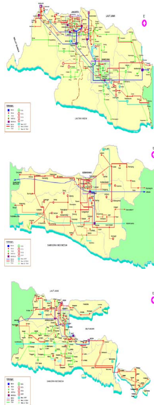
Gambar 2 Sistem tenaga listrik JAMALI yang terdiri dari pembangkit hidrotermis pada: (a) Bagian Jawa Barat dan DKI Jakarta (b) Bagian Jawa Tengah dan DIY (c) Bagian Jawa Timur & Bali

dengan masuknya PLTA Pompa ke sistem Jawa-Madura-Bali,