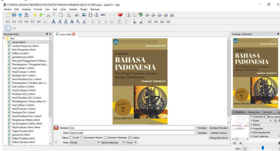
Gambar 1. Tampilan E-Modul dalam Software Sigil Saat Proses Pembuatan

dan soal latihan yang disesuaikan dengan Capaian Pembelajaran elemen membaca dan memirsa pada kurikulum prototipe.