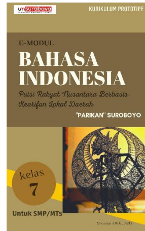
Gambar 5. Revisi Sampul dari Catatan Validator