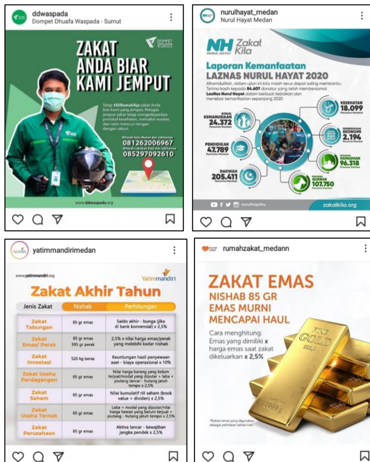
Gambar 1 Promosi LAZ melalui Platform Digital Instagram

setelahnya. Konten postingan LAZ ini sangat beragama, mulai dari kampanye berzakat, informasi program, pengetahuan dasar zakat sampai dengan bentuk pelayanan dan fasilitas penghimpunan zakat. Berikut penulis tampilkan contoh promosi yang dilakukan oleh amil melalui kanal digital tersebut: