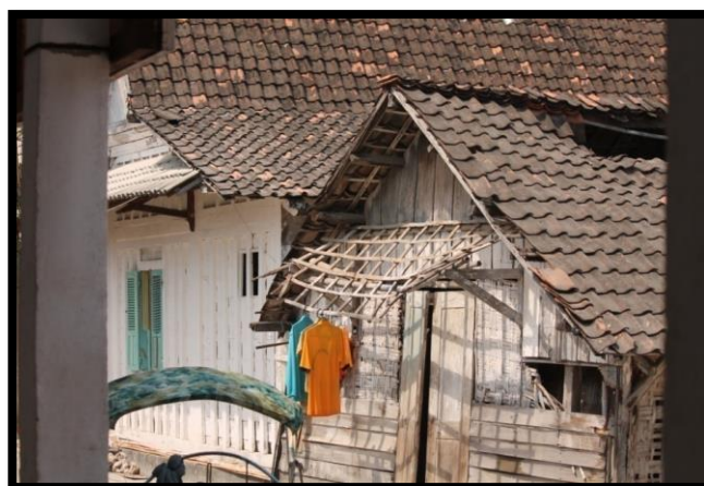
Gambar 1 . Rumah Petani Garam dengan Dinding Bilik

Hasil penelitian lapangan diperoleh data tentang besarnya jumlah kelahiran selama tahun 2013 cukup tinggi, yaitu mencapai 28 bayi, dan angka kematiannya sepanjang tahun yang sama adalah 16 jiwa. Jumlah perkawinan (yang menikah) sepanjang tahun 2013 adalah 34 pasang, dengan perceraian sebanyak 6 pasang. Tingkat mobilitas penduduk antar wilayah mencapai 80%, artinya hampir semua penduduk di Desa Pliwetan pernah melakukan mobilitas ke daerah lain (keluar desanya) walaupun masih dalam kecamatan atau kabupaten yang sama. Adapun untuk mobilitas sosial (perubahan status sosial) seseorang untuk usia dewasa dan tua tidak banyak mengalami perubahan, tapi untuk umur remaja dan anak-anak banyak mengalami perubahan, walaupun secara khusus tidak terdapat catatan administrasinya di kelurahan.